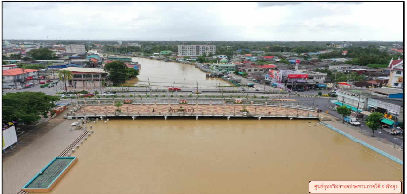
ศูนย์อุทกวิทยาชลประทานภาคใต้ จ.พัทลุง