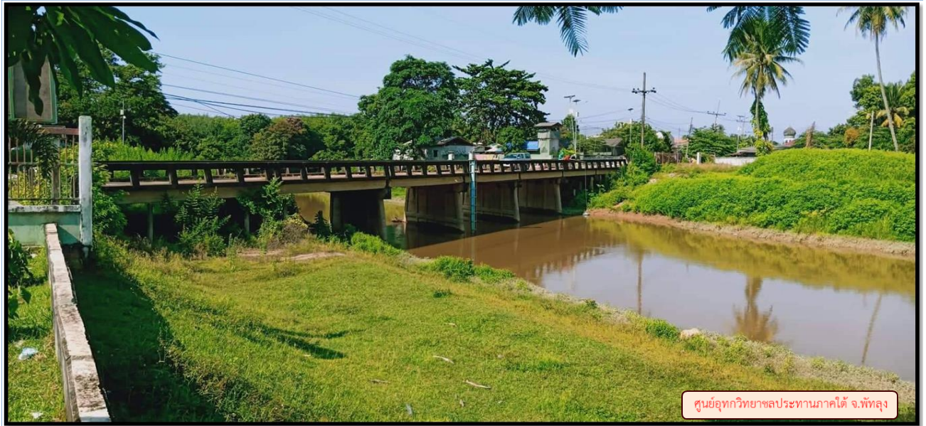
ศูนย์อุทกวิทยาชลประทานภาคใต้ จ.พิจิตร