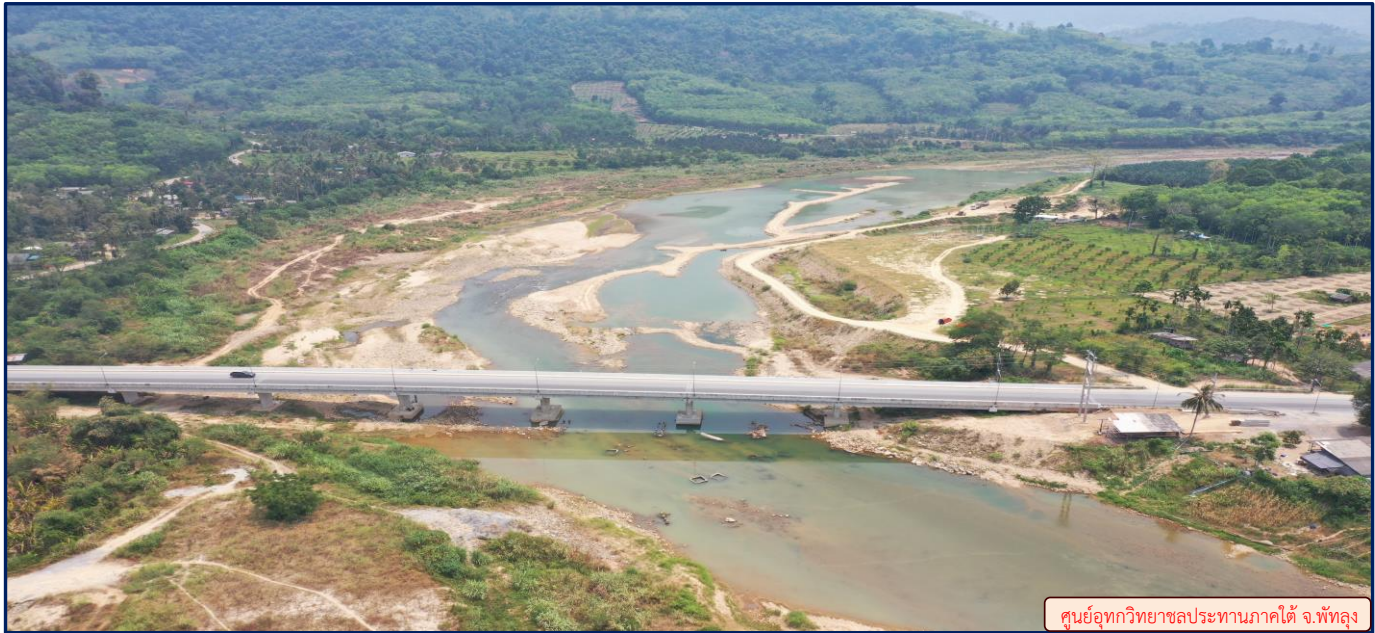
ศูนย์อุทกวิทยาชลประทานภาคใต้ จ.พัทลุง