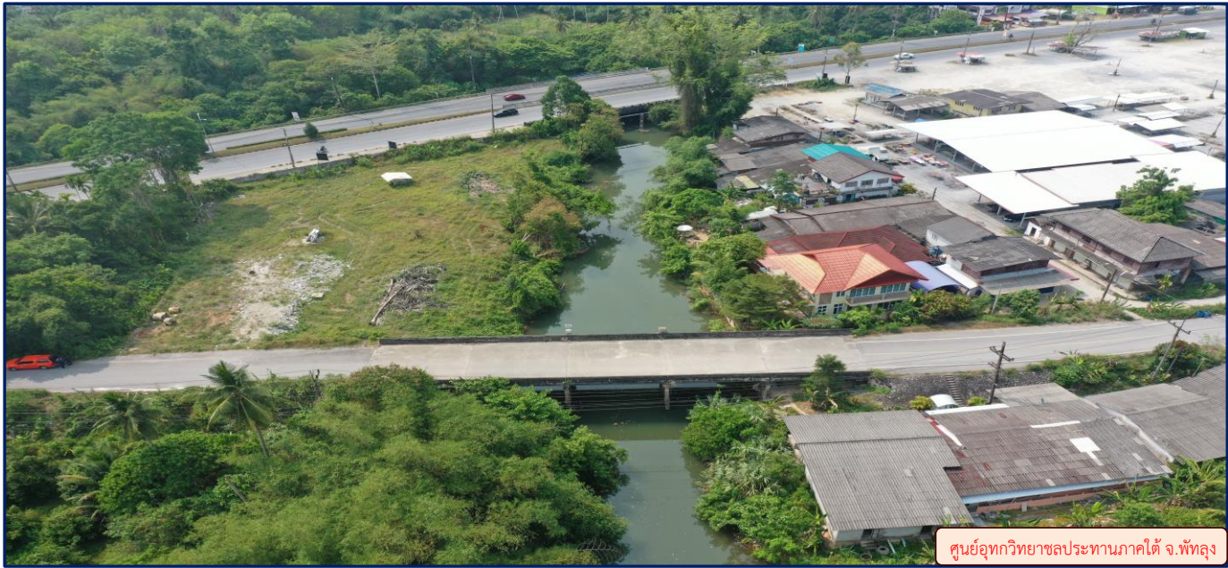
ศูนย์อุทกวิทยาชลประทานภาคใต้ จ.พัทลุง