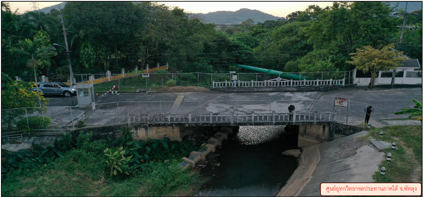
ศูนย์อุทกวิทยาชลประทานภาคใต้ จ.พัทลุง