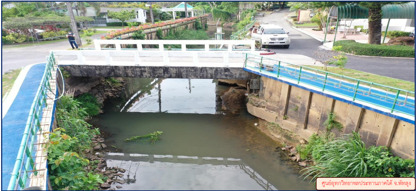
ศูนย์อุทกวิทยาชลประทานภาคใต้ จ.พัทลุง