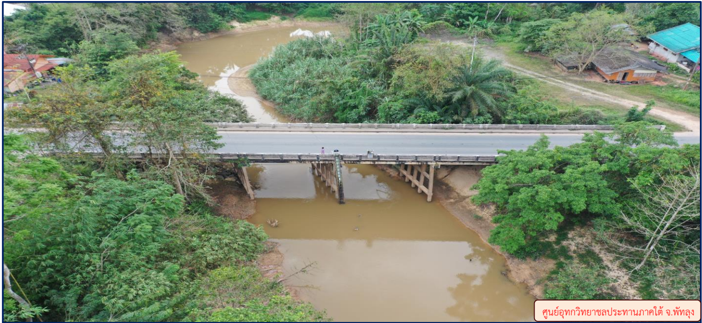
ศูนย์อุทกวิทยาชลประทานภาคใต้ จ.พัทลุง