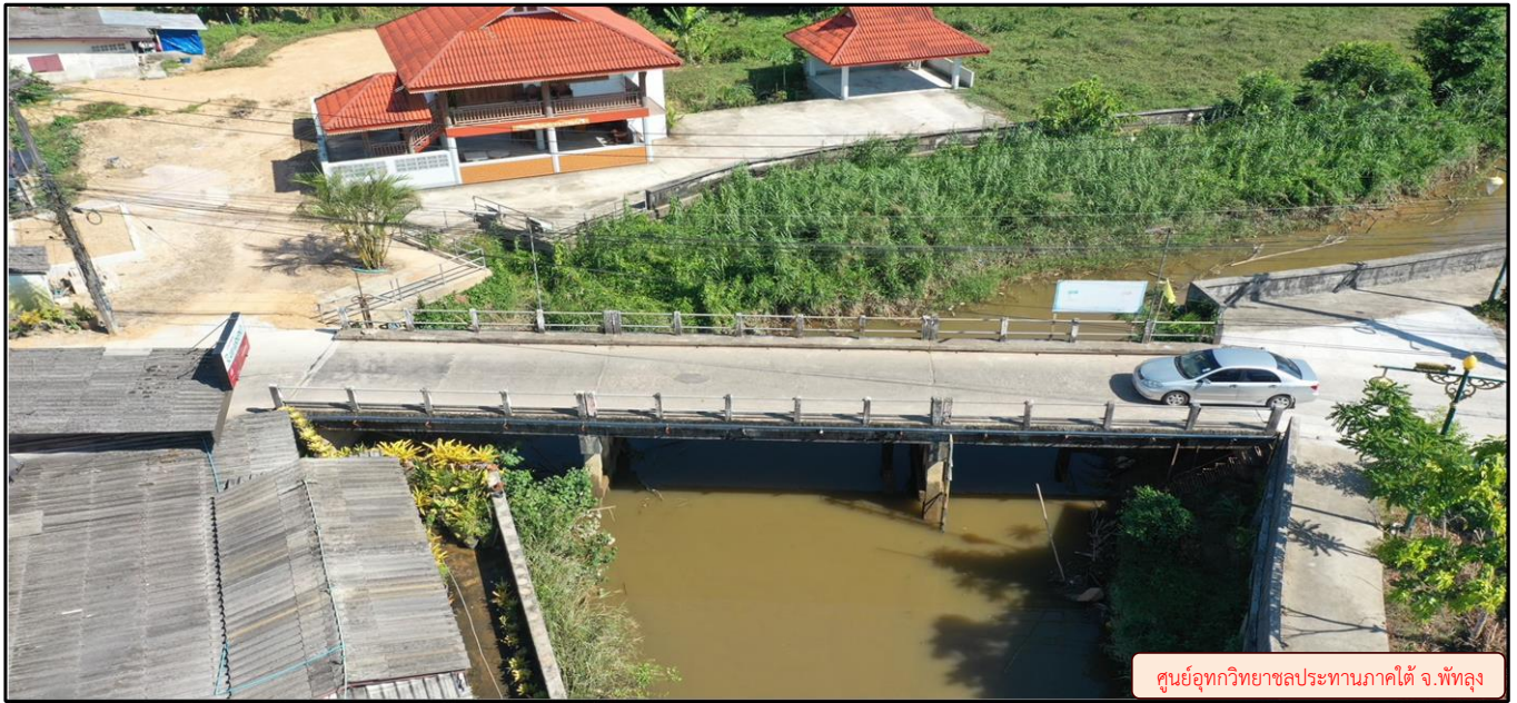
ศูนย์อุทกวิทยาชลประทานภาคใต้ จ.พัทลุง