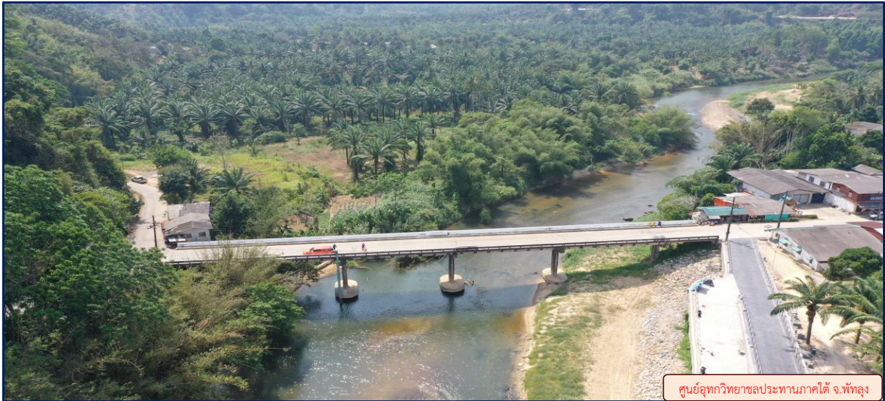
ศูนย์อุทกวิทยาสลประทานภาคใต้ จ.พัทลุง