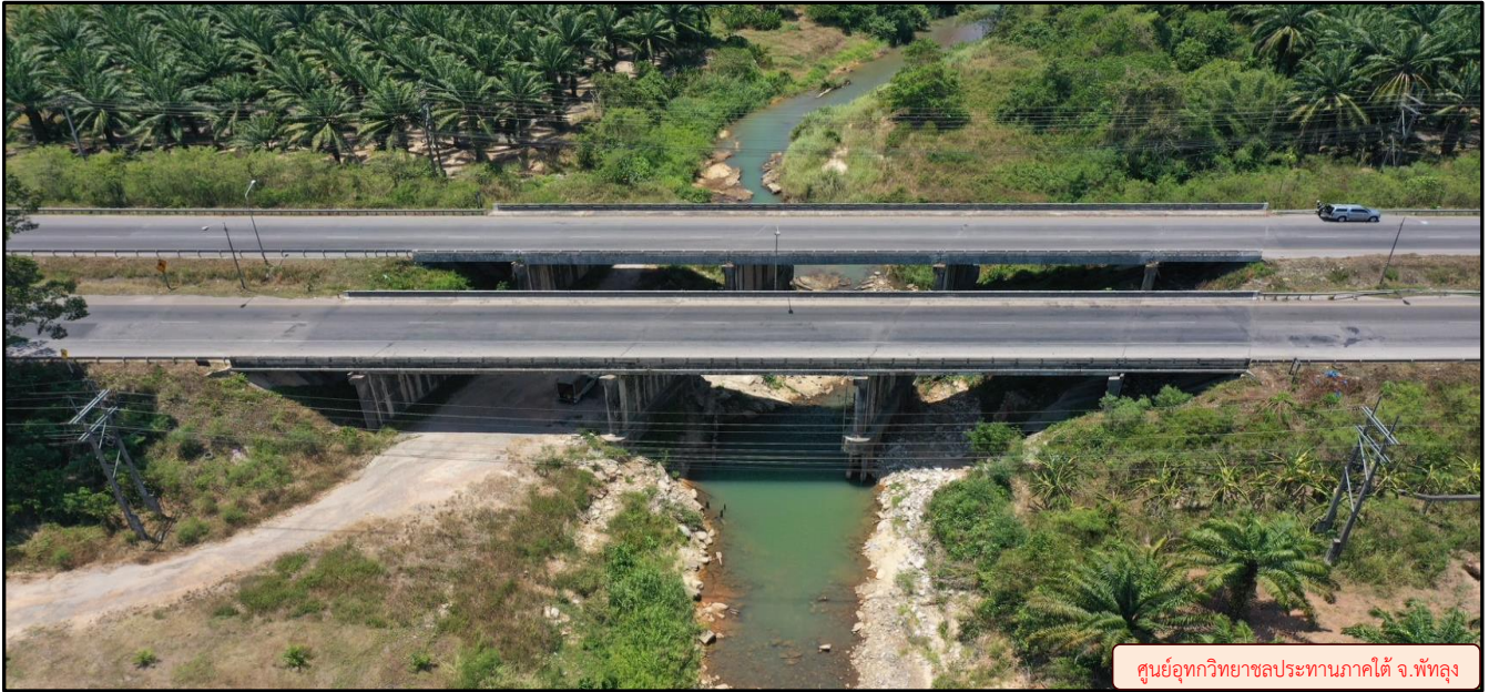
ศูนย์อุทกวิทยาชลประทานภาคใต้ จ.พัทลุง