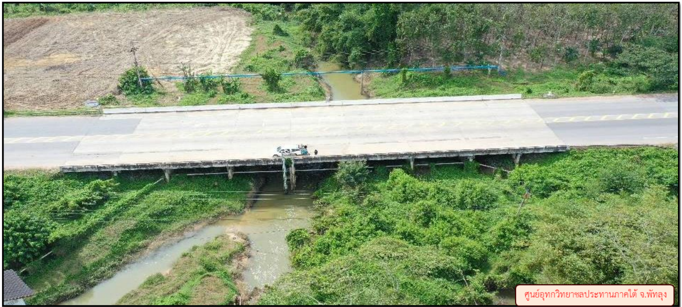
ศูนย์อุทกวิทยาชลประทานภาคใต้ จ.พัทลุง