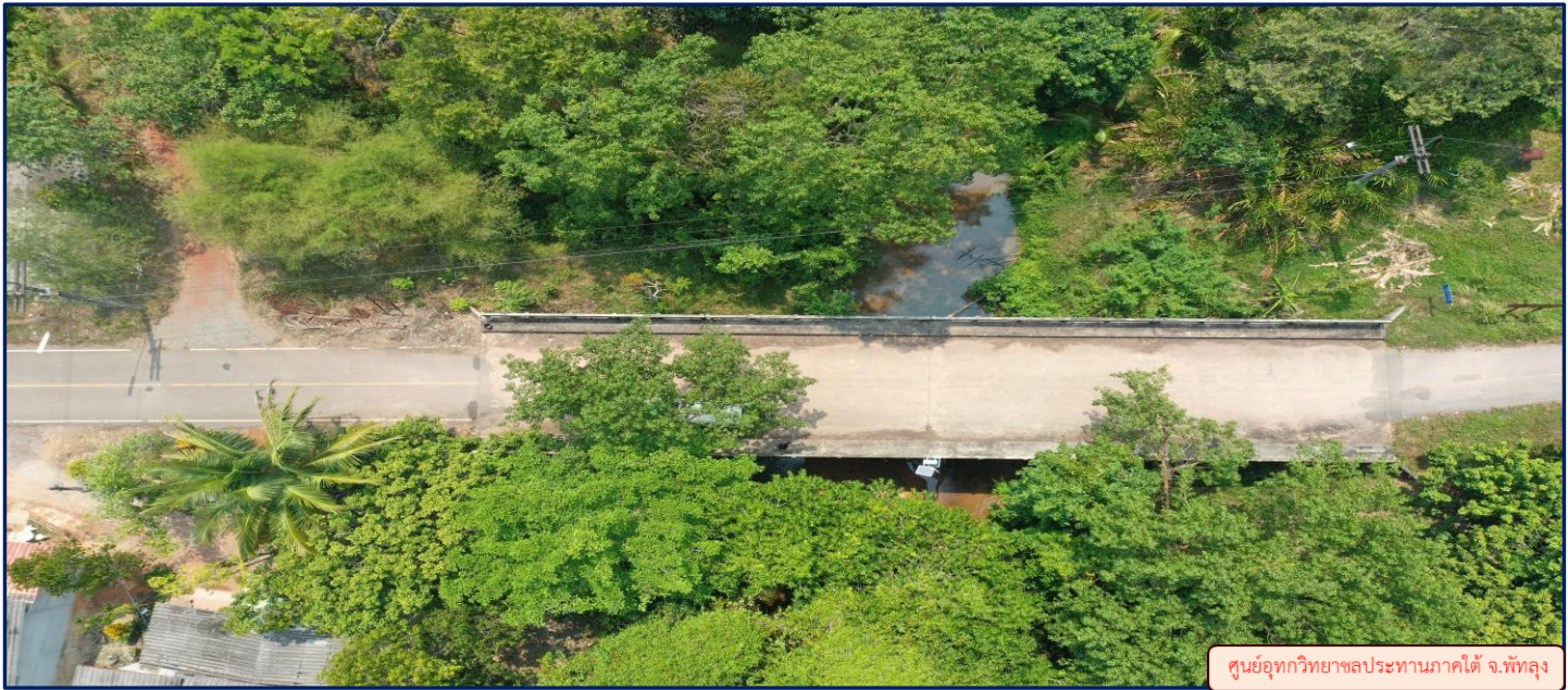
ศูนย์อุทกวิทยาชลประทานภาคใต้ จ.พัทลุง