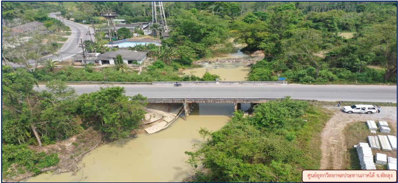
ศูนย์อุทกวิทยาชลประทานภาคใต้ จ.พัทลุง