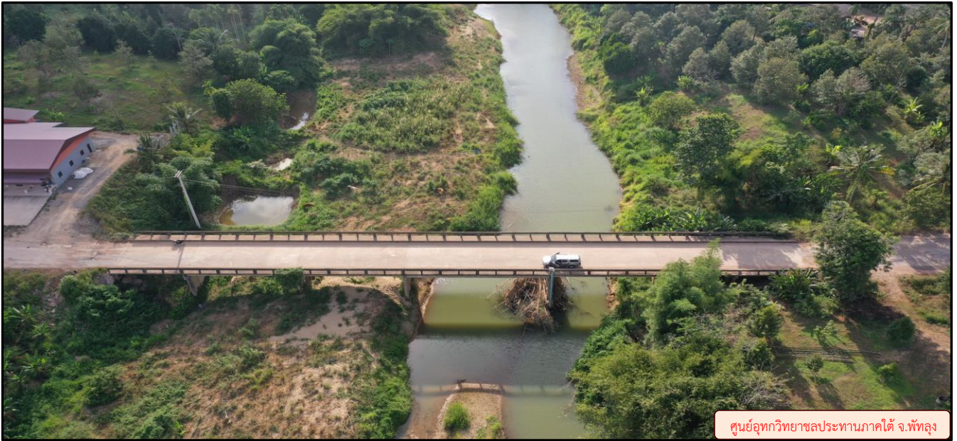
ศูนย์อุทกวิทยาชลประทานภาคใต้ จ.พัทลุง