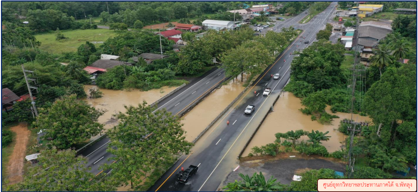
ศูนย์อุทกวิทยาชลประทานภาคใต้ จ.พัทลุง