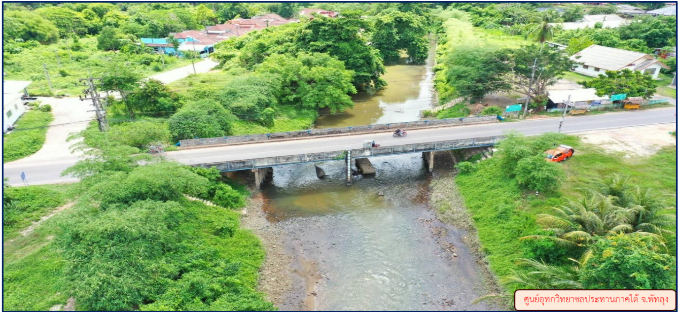
ศูนย์อุทกวิทยาชลประทานภาคใต้ จ.พัทลุง