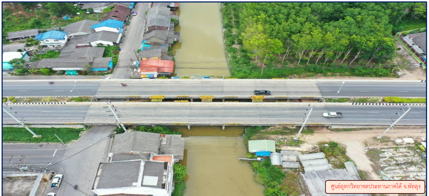
ศูนย์อุทกวิทยาสลประทานภาคใต้ จ.พัทลุง