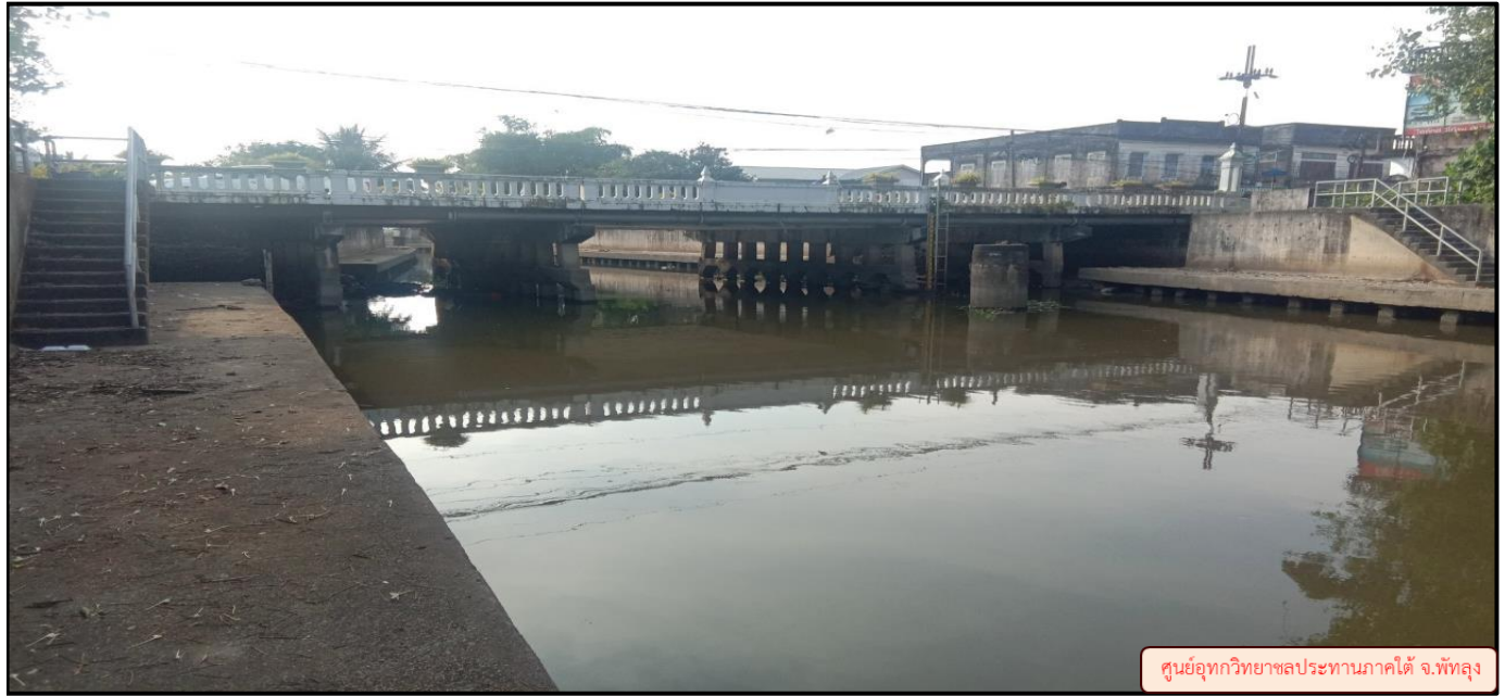
ศูนย์อุทกวิทยาชลประทานภาคใต้ จ.พัทลุง