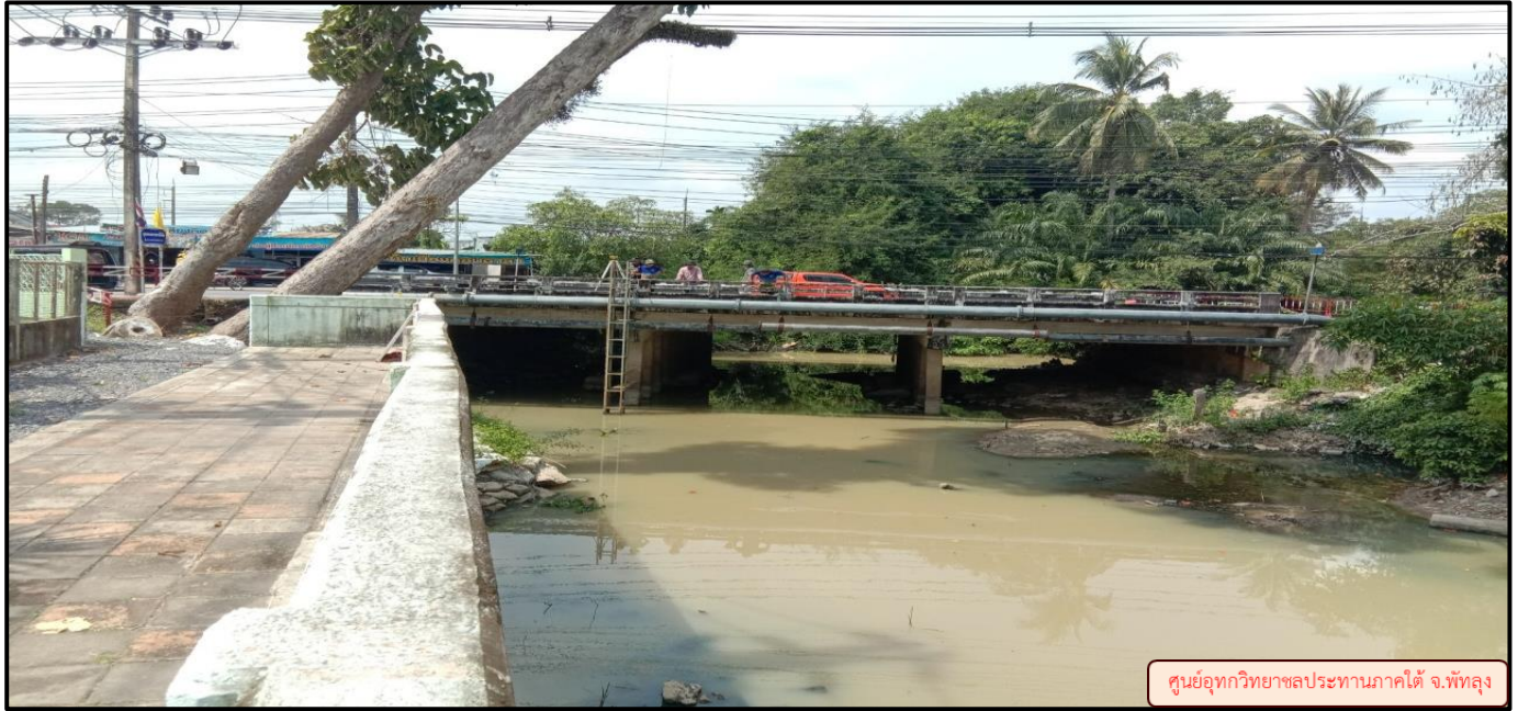
ศูนย์อุทกวิทยาชลประทานภาคใต้ จ.พัทลุง