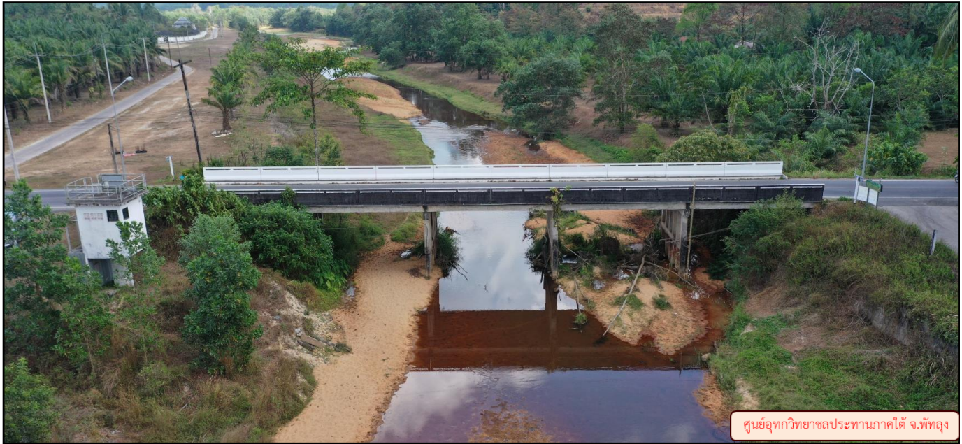
ศูนย์อุทกวิทยาชลประทานภาคใต้ จ.พังงา