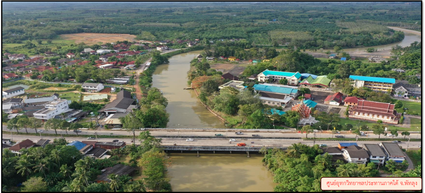
ศูนย์อุทกวิทยาชลประทานภาคใต้ จ.พัทลุง