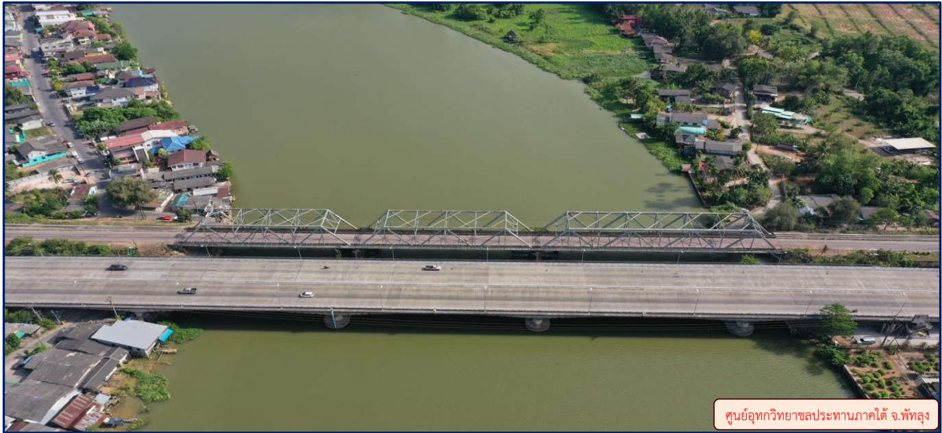
ศูนย์อุทกวิทยาชลประทานภาคใต้ จ.พัทลุง