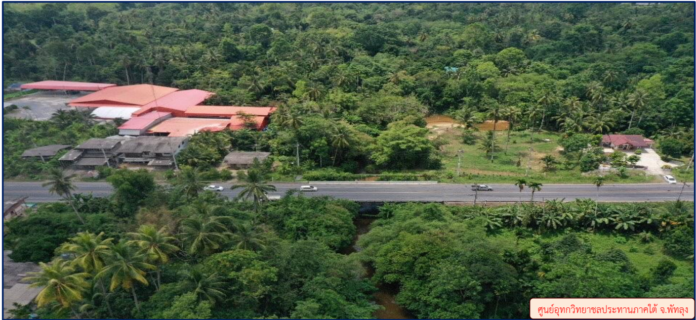
ศูนย์อุทกวิทยาชลประทานภาคใต้ จ.พัทลุง