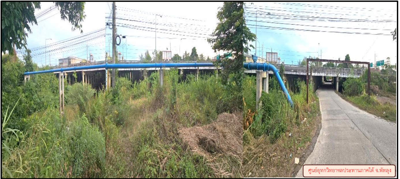
ศูนย์อุทกวิทยาชลประทานภาคใต้ จ.พัทลุง